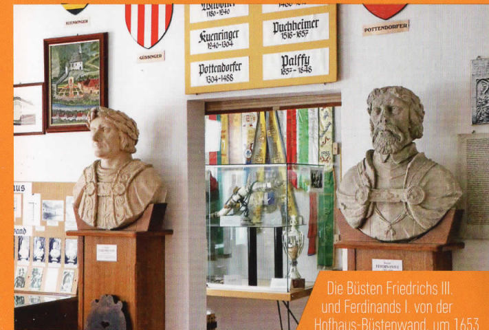
Die Büsten Friedrichs III. und Ferdinands I. von der Hofhaus-Büstenwand, um 1653