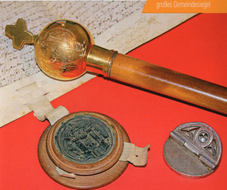
Marktrichterstab und großes Gemeindegelb

Aber auch die neuere Zeit ist durch Exponate, Bilder und Dokumente vertreten. Bei dieser Vielfalt ist sicher auch für Sie ein interessanter Bereich dabei. Kommen Sie vorbei und versinken Sie in der spannenden Zeitgeschichte. Die ehrenamtlichen Mitarbeiter freuen sich auf Ihren Besuch!