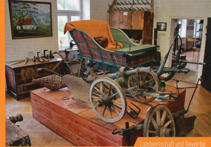
Landwirtschaft und Gewerbe