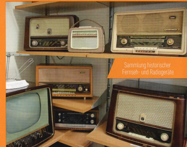
Sammlung historischer Fernseh- und Radiogeräte