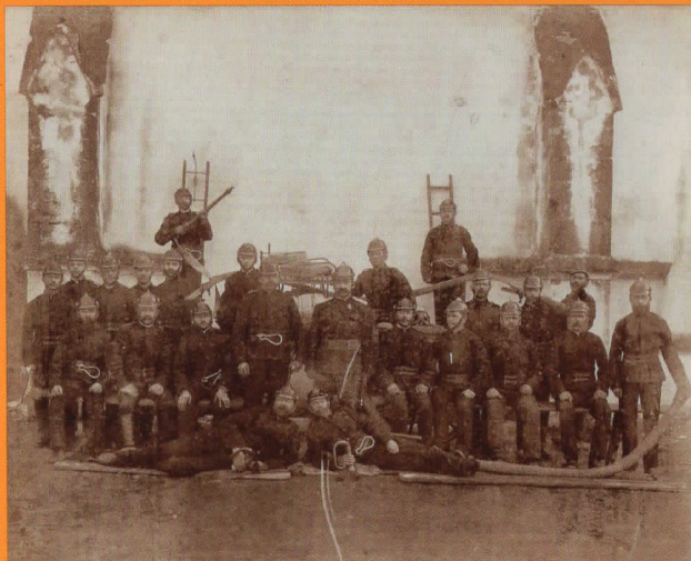
Gruppenfoto von 1894 zum 20-jährigen Gründungsfest der Kirchschiager Feuerwehr