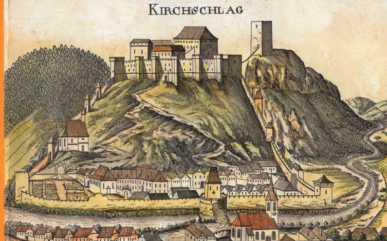
Vischer-Stich aus dem Jahre 1672